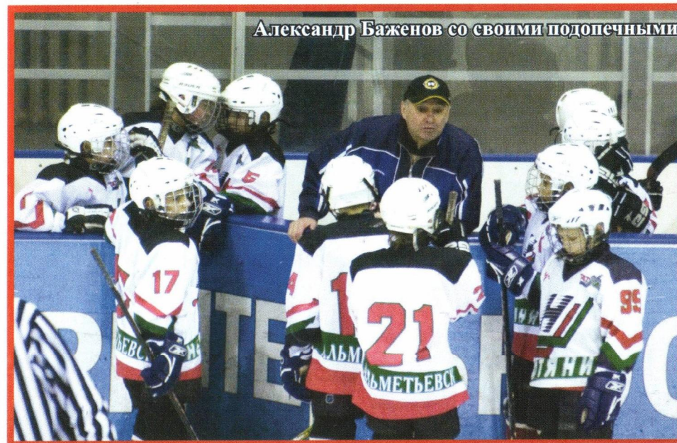
Программа №7 подготовлена пресс-службой АХК «Нефтяник».