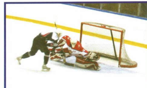
2005 год. Второй турнир. Играют «Торпедо» (Н.Н.) - «Ижсталь» (Иж)