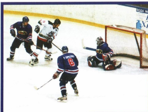
Атакуют «Нефтяник» (А)