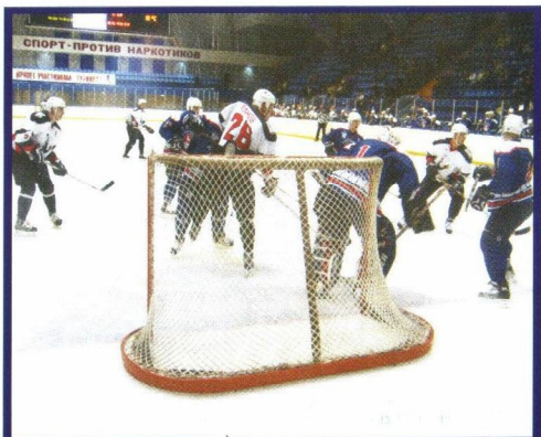
2005 год. Второй турнир. Играют «Торпедо»(Н.Н) - «Трактор»(Ч)