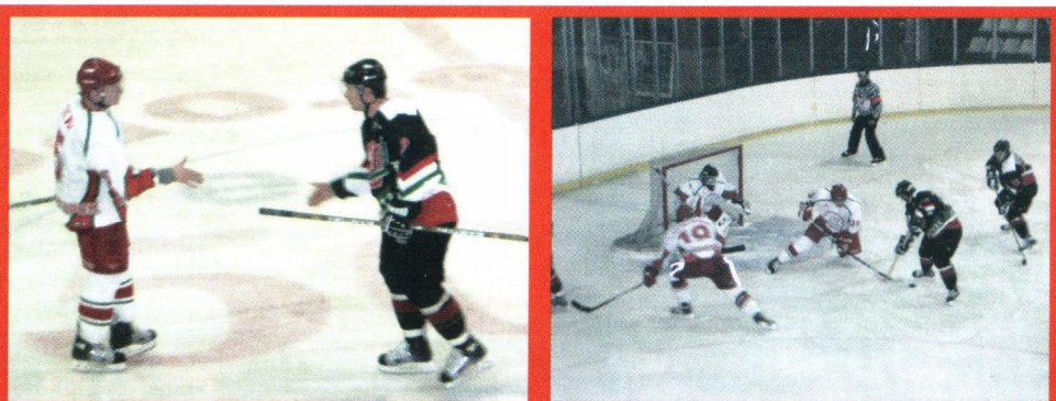
1 ноября 2000 года. «Нефтяник» Лениногорск - «Нефтяник» Альметьевск (1:6)