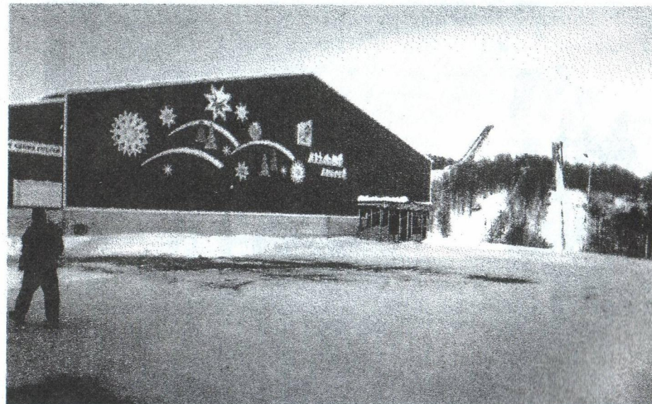
Лениногорск. Дворец спорта.

2000/2001 - 11-е место (из 13 участников) в восточной зоне высшей лиги.