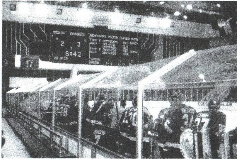
ХК ЦСКА – «Витязь» - 2:3

Клуб болельщиков организовал автобусные поездки на матчи с «Химиком» и ХК ЦСКА. Очень приятно хоккеистам, когда за них болеют на чужой площадке. Около трёхсот человек побывало в Москве, а хоккеисты отблагодарили болельщиков победой.